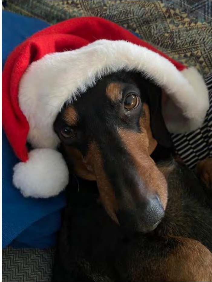
GOLIA Ex RescueBoyBPP