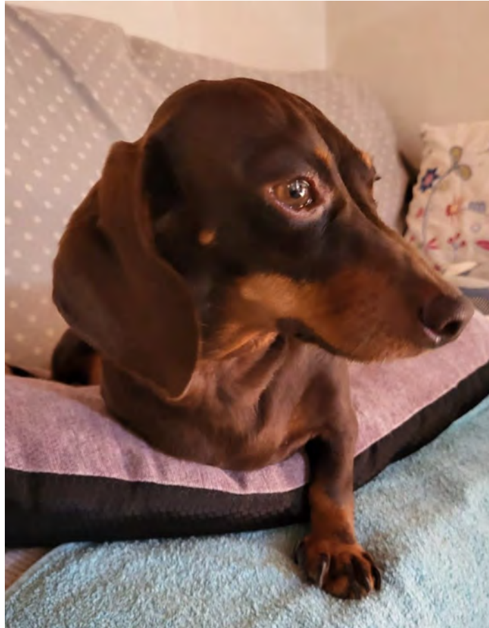
SISSI Ex RescueGirlBPP