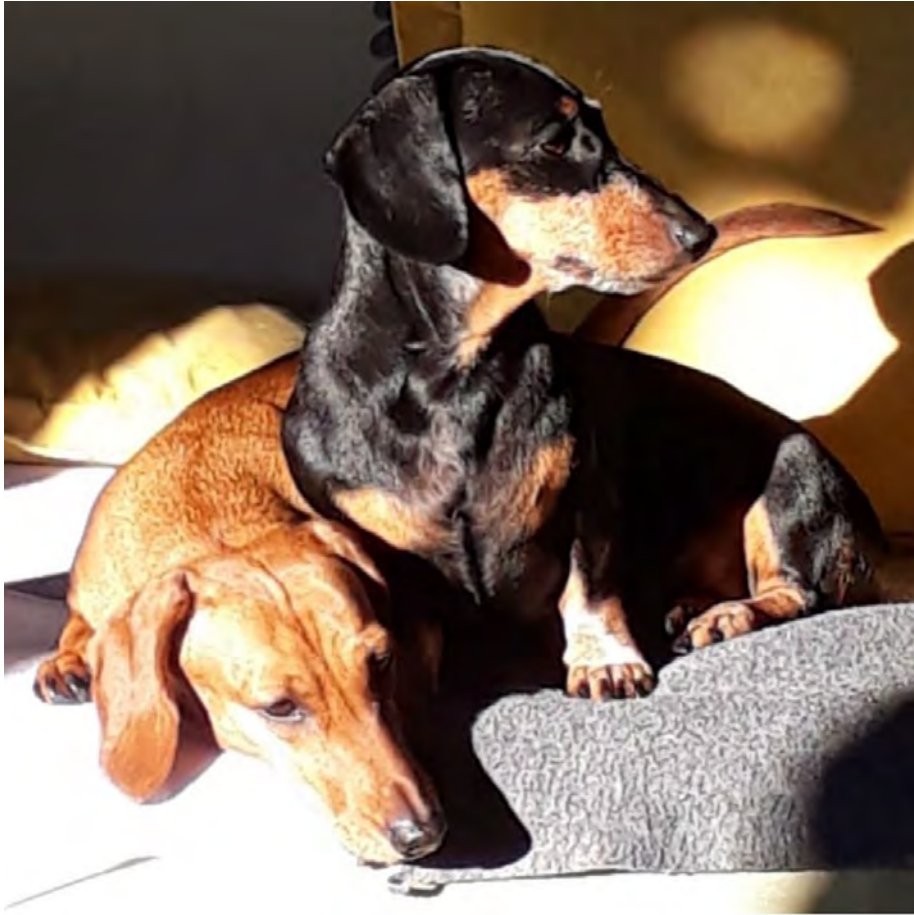
MORA Ex RescueGirlBPP