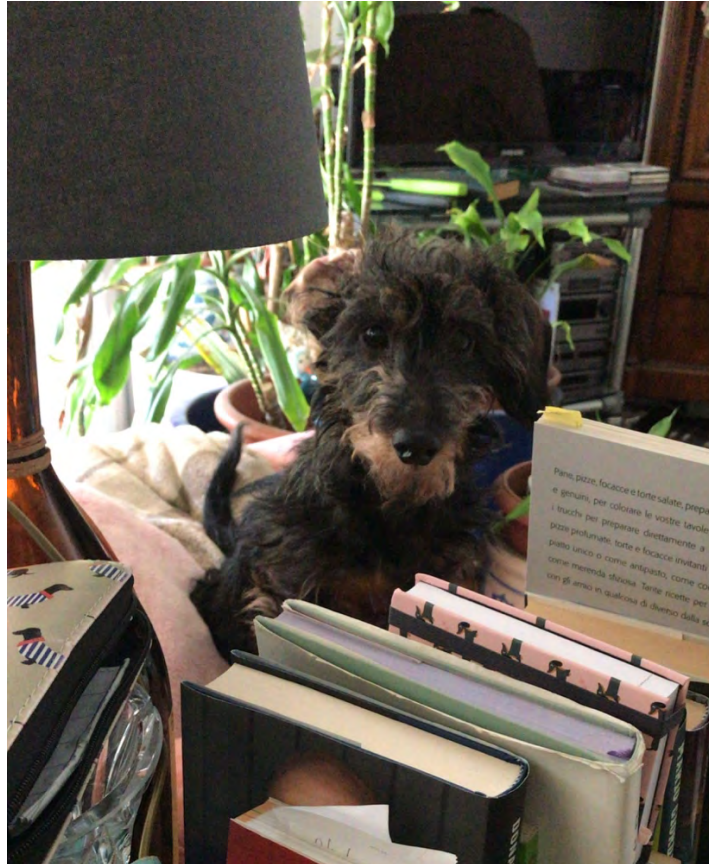
FABER Ex RescueBoyBPP