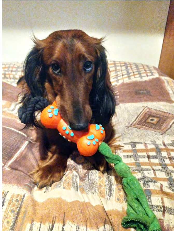
ALI' Ex RescueBoyBPP