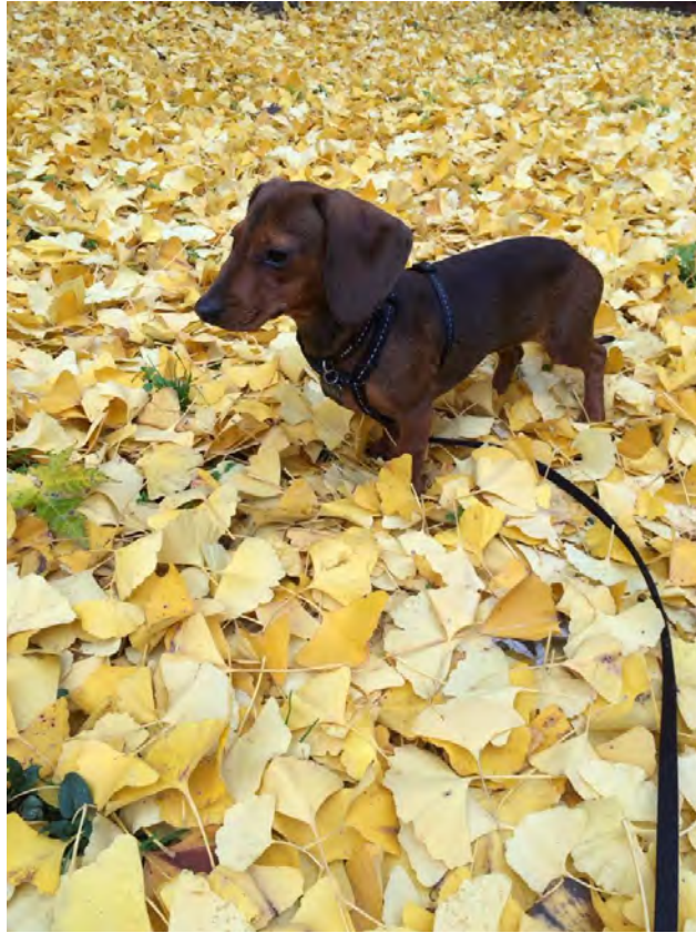
OLIVIA Ex RescueGirlBPP