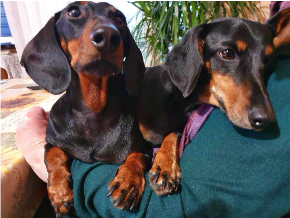
ARTU' E CAMILLA Ex RescueBoyandGirlBPP