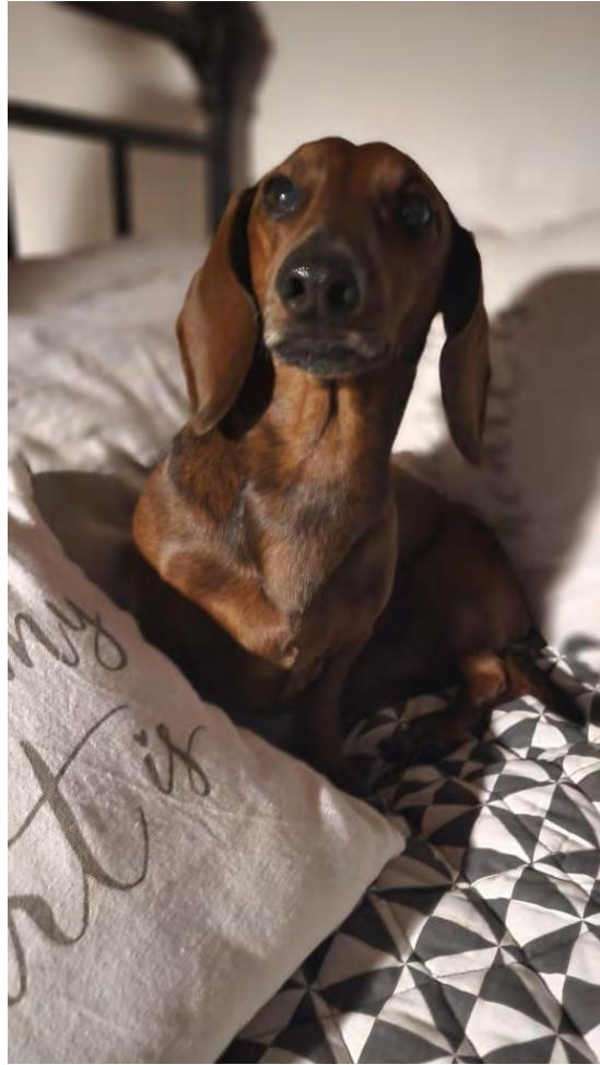
MOZART Ex RescueBoyBPP