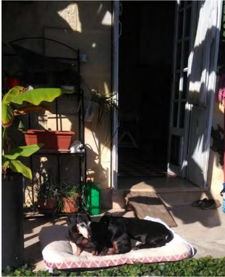
MAGO' Ex RescueGirlBPP